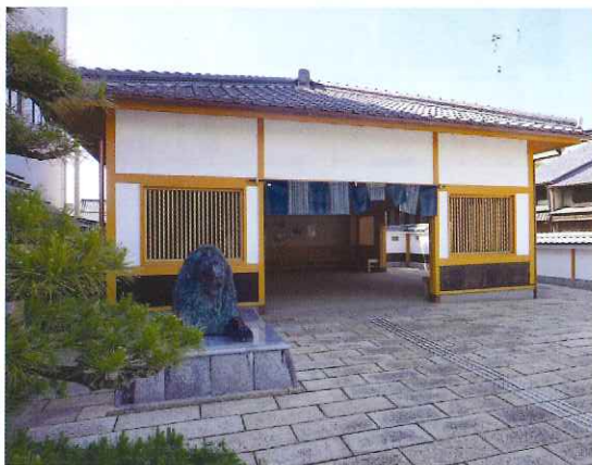
豪商ポケットパーク