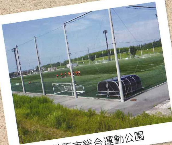
松阪市総合運動公園

〒515-0814 松阪市久保田町161番地 TEL 0598-26-0523 FAX0598-26-0917