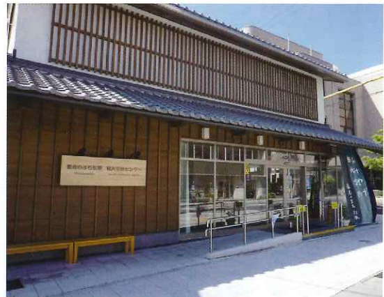
観光交流センター

松阪市や観光協会から発注の就業場所です。 どの施設も、市外からのお客さまが訪れ、松阪を楽しんでいただく場所です。 その場所にシルバー人材センター会員が携わらせていただける喜びを胸に、 より一層心を込めて就業したいと考えています。