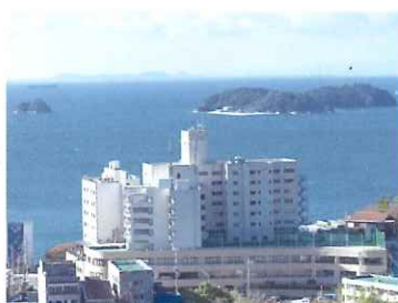
宿泊／ホテル明山荘