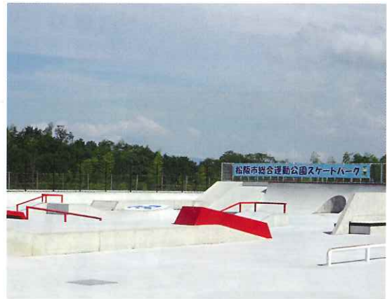
スケートパーク（松阪市総合運動公園）