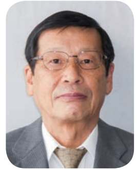
代表理事・副理事長