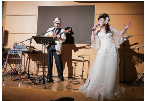
オープニングアトラクション “青春プレイバック”ライブショー