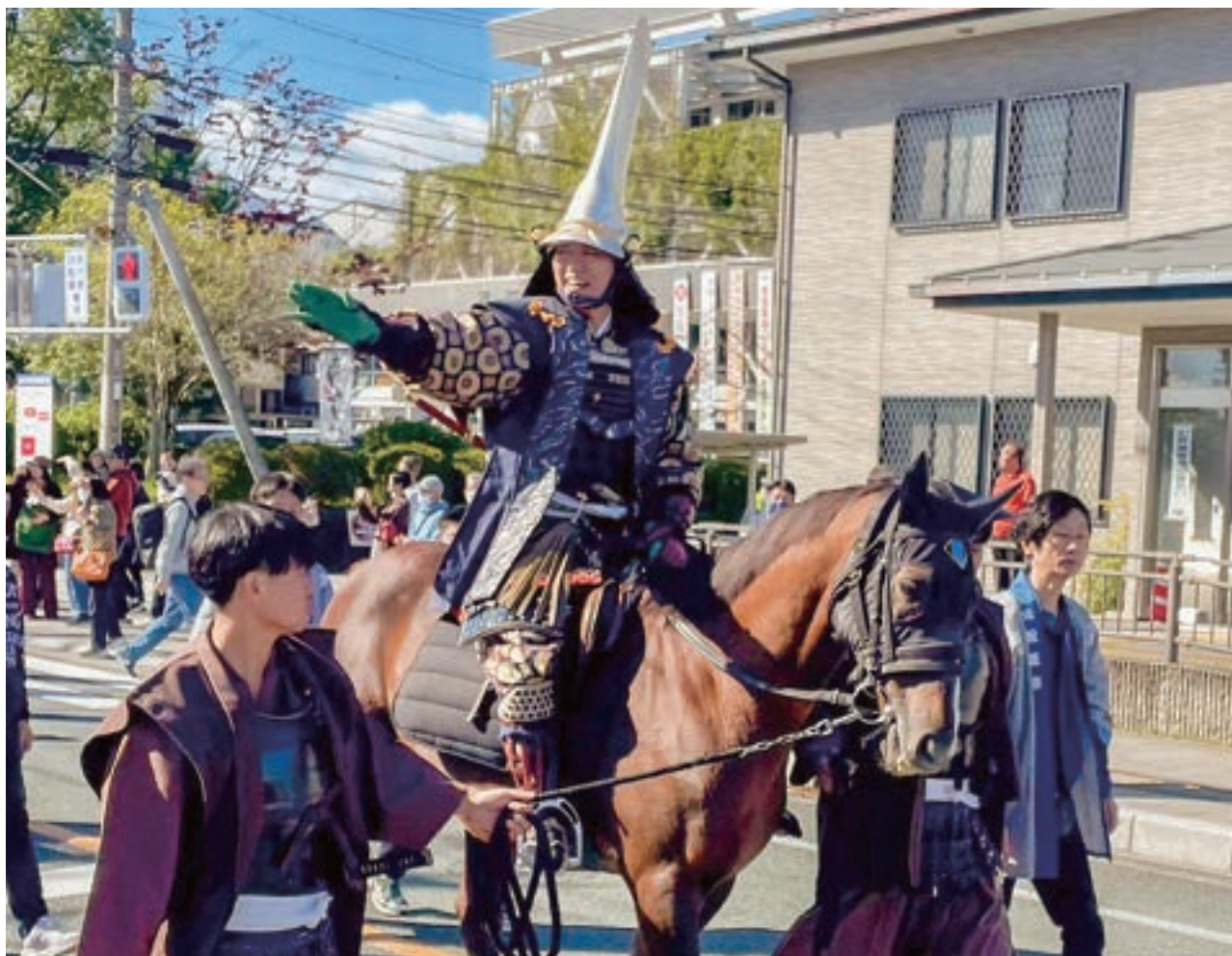
松阪三大祭り「氏郷まつり」武者行列

〒515-0814 松阪市久保田町 161 番地 TEL 0598-26-0523 FAX 0598-26-0917