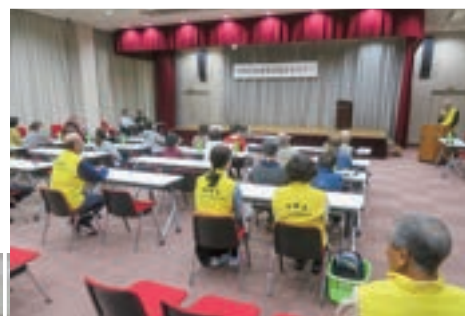
特殊詐欺防止セミナーのようす