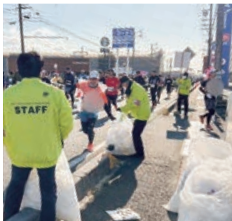
三重まつさかマラソン 2024 のようす

各担当場所における、会員さんの心のこもった“おもてなし”はランナーの皆さんから好評でした。